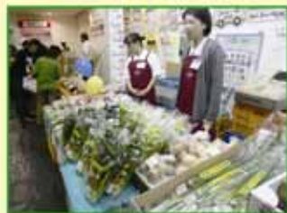
*詳しくは裏面をご覧ください